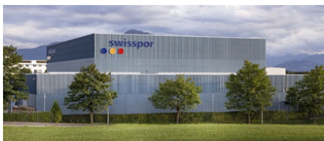
Hauptsitz der swisspor Gruppe in Steinhausen, Schweiz.

Die swisspor Gruppe ist die führende Entwicklerin, Herstellerin und Anbieterin von Produkten und Systemen für energieeffiziente und ästhetisch ansprechende Gebäudehüllen, für die Dämmung und Abdichtung von unterirdischen Bauwerken, Fassaden und Dächern. Unter dem Credo «Wir machen Gebäude energieeffizient und wirtschaftlich» positioniert sich die Unternehmensgruppe mit einem vielfältigen Produktsortiment, das modernste und zukunftsweisende Lösungen umfasst. Die Gruppe beschäftigt über 5000 Mitarbeitende und ist an 38 Standorten in zehn europäischen Ländern tätig. Der Hauptsitz und 12 weitere Standorte befinden sich in der Schweiz. Das Unternehmen ist seit der Gründung im Jahr 1971 in Familienbesitz. Zur Gruppe gehören swisspor, Swisspearl, ZZ (Zürcher Ziegeleien AG), DASPAG AG, Wagner Systeme, Swiss Fassaden Technik AG sowie TigaTech.