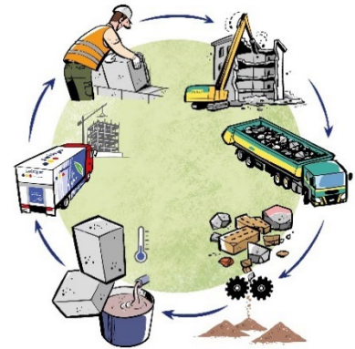
Der Stoffkreislauf von «swissporECORIT».

Das Urban-Mining-Modell betrachtet Schweizer Dörfer und Städte als Rohstoffminen. Wenn Häuser abgerissen werden, entstehen pro Jahr rund 7,5 Millionen Tonnen mineralisches Abbruchmaterial. Diese Abfälle enthalten viele wertvolle natürliche Rohstoffe. Urban Mining hat zum Ziel, Bauabfälle maximal zu verwerten. Mit diesem nachhaltigen Stoffkreislauf sichern Baustoffherstellende wie die swisspor die langfristige Versorgung mit Baustoffen. Dank der lokalen Kreislaufwirtschaft bleibt die Wertschöpfung dauerhaft in der Schweiz und ermöglicht die Schaffung neuer Arbeitsplätze.